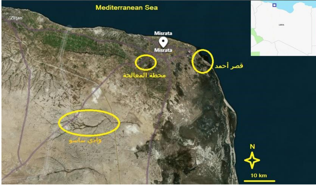
صورة 1. مناطق الدراسة.